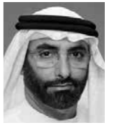
معالي محمد أحمد البواردي، رئيس مجلس إدارة جمعية الإمارات للطبيعة